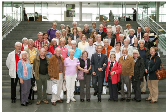
Zusammen mit den Teilnehmern der dritten diesjährigen Informationsfahrt für politisch Interessierte.

In den vergangenen zwei Monaten haben mich erneut eine Reihe von Gruppen aus meinem Bremer Wahlkreis in Berlin besucht, um sich über meine Arbeit als Abgeordneter in Berlin, aber auch über Politik und Arbeitsweise des Bundestages im Allgemeinen zu informieren. Im persönlichen Gespräch habe ich Ihnen von meinem Alltag, meinen Erfahrungen der letzten zwei Jahre im Bundestag berichtet, aber auch meine Haltung zu aktuellen politischen Themen dargestellt.