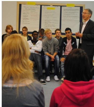
Eine spannende Diskussion mit vielen Wortmeldungen führte ich mit Gymnasiasten des SZ Obervieland

Schülern Berührungsängste abgebaut hat. Doch die Schüler machten auch klar, dass sie gemeinsam mit ihren behinderten Klassenkameraden den Stoff in Geschichte nicht schaffen. Sie halten Kunst und Musik als kreative Fächer für besser geeignet, um gemeinsam zu lernen. Mitgenommen habe ich, dass die Schüler als Experten mit einbezogen werden sollten, um für die sogenannte Inklusion gute Lösungen zu finden.